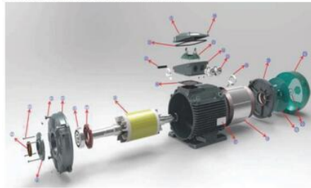
Exploded view of WE3 motor construction with key part list